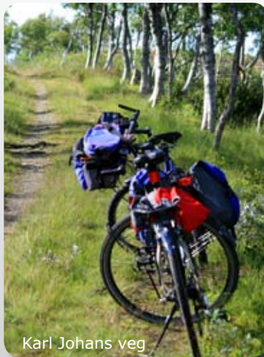
Karl Johans veg