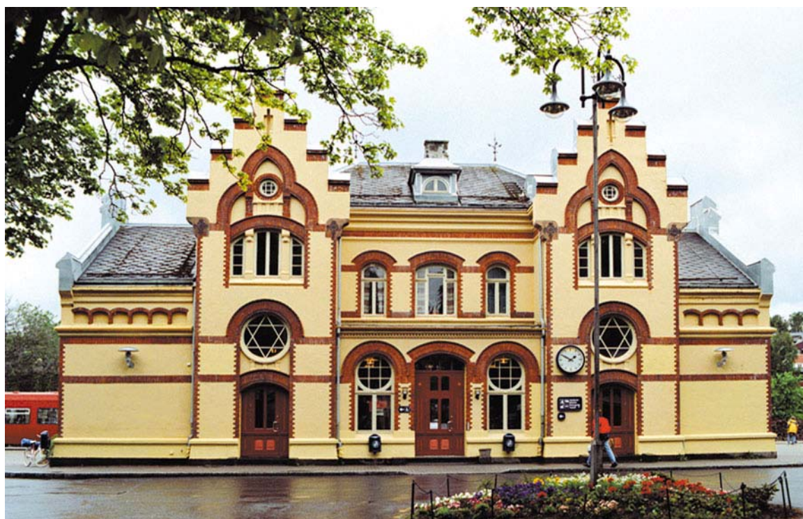
Levanger stasjon – historisk bygning som ligger midt i byen.

Turistinformasjon finner du på servicekontoret i Levanger rådhus, 1. etg., samt på Levanger kommune sin hjemmeside under i .