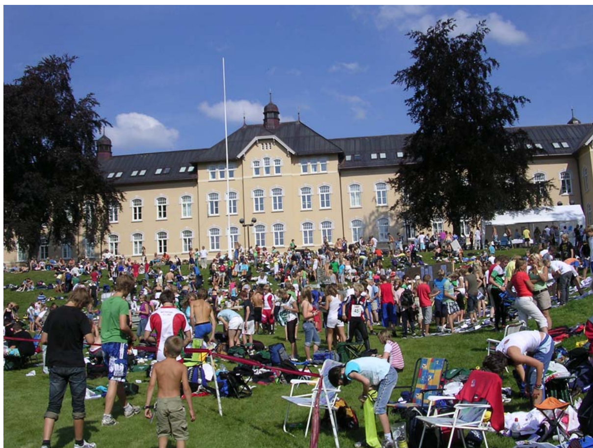
Hint på Røstad – et yrende studentliv