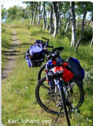
Karl Johans veg