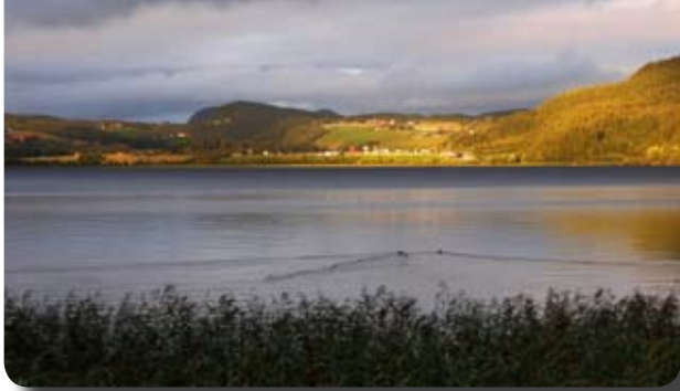
Leksdalsvatnet fra Haukåa