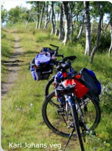
Karl Johans veg