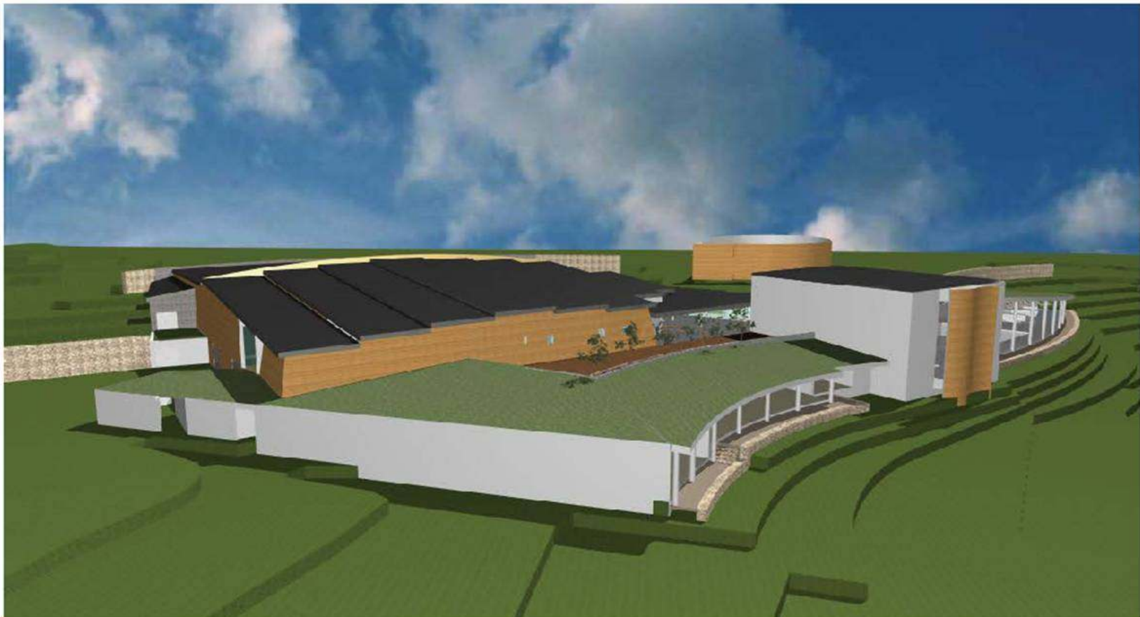
3D oversikt fra nord