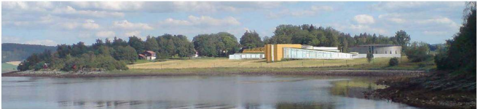
Fotomontasje fra øst