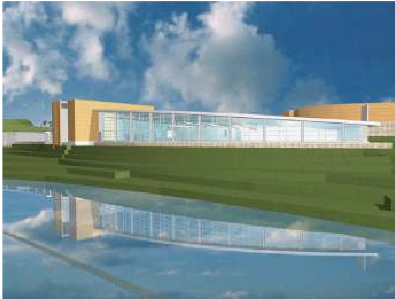
3D utsnitt fra øst