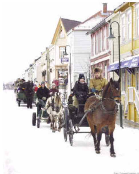
Fra Marsimartnan.

På landsbasis forsvinner et betydelig antall kulturminner hvert år, det er neppe grunn til å tro at situasjonen i Levanger er særlig bedre. Mange forhold truer kulturminnene som feks.: Næringsutbygging, hytte-/boligbygging, skog-/landbruk, veibygging, brann/forurensning ukritisk rehabilitering, mangel på kunnskap/kjennskap.