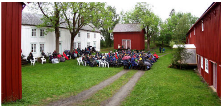
Fra opera i Bjørvika på Ytterøy.

Både barn, studenter, arbeidsplasser/næringslivet, kor, orkestre og tilreisende aktører gir sceneforestillinger jevnlig i forskjellige lokaler og arenaer i kommunen.