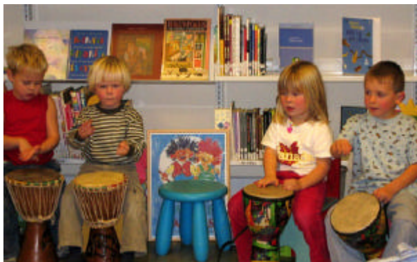
Førskolebarn har musikkstund i barneavdelingen.

Etter at Levanger bibliotek flyttet til nye lokaler har både besøk og utlån økt med over 30%. Utlån av barne- og ungdomslitteratur har økt med hele 57%.