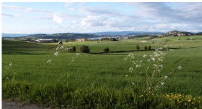
Motiv fra kulturlandskapet på Skogn

Kommunen er preget av variert byggeskikk fra særpreget småby-bebyggelse til fine gårdstun. Levanger har mange fine eksempler på trøndertun hvor trønderlåna, driftsbygningene og vegetasjonen danner en harmonisk enhet som er med på å gi landskapet karakter.