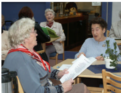
Fra allsang i rådhuset.

Kulturdeltakelse er sentral for å skape identitet og tilhørighet i lokalsamfunnet, bidrar til å styrke sosiale nettverk, og er derfor svært viktig for den enkelte innbygger. Som overordnet tenkning skal planen bidra til at kultur blir tilgjengelig for alle i kommunen uavhengig av alder, kjønn, funksjonsevne, bosted, etnisk bakgrunn eller "sosial tilhørighet".