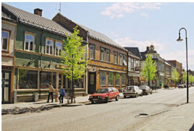
Fra Kirkegata.

Trehusbegyggelsen fra forrige århundreskifte fikk i hovedsak stå i fred fram til 1960 årene. På 1960 og -70-tallet foregikk endel sanering av eldre bebyggelse og de nye bygningene fikk andre dimensjoner og materialer enn de tradisjonelle. Økt forståelse for verdiene i den gamle bebyggelsen ut gjennom 1980 og -90-tallet, førte til flere utredningsarbeider og planer.