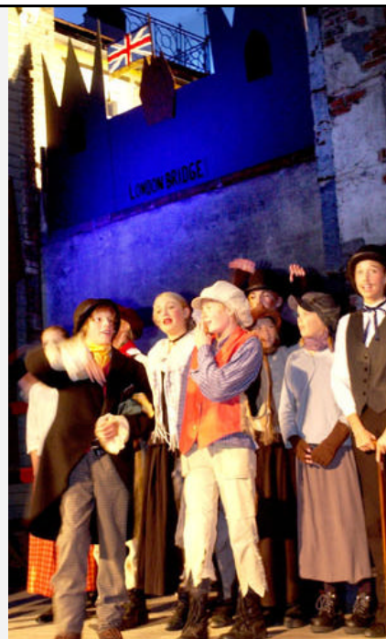
Kulturskolen Oliver-forestilling.

Faktarute: viser ulike arenaer i Levanger.