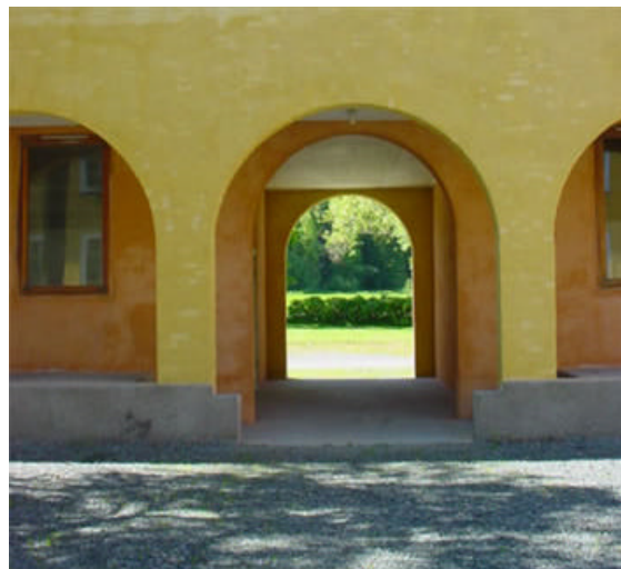
Fra luftegården på Falstad.

Utviklingen innen utdanning i kunst- og kulturfag har dannet grunnlag for at flere har tilegnet seg høy utdanning og stor grad av profesjonalitet innen flere kunst- og kulturområder.