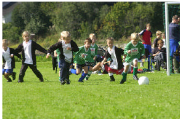
Fra Levanger Cup Moan.

navnet Moan Idrettspark. I dag er anlegget et heleid kommunalt selskap og med navn Levanger Fritidspark. Fritidsparken består av syv anleggsenheter. Dessuten finnes lekeplass, minigolfanlegg og grøntanlegg med asfalterte stier.