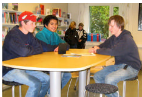
Ungdomsavdelingen biblioteket.

Med møteplasser i denne sammenheng forstår vi alle steder der kultur foregår. Møteplassen gir rammen rundt aktiviteten og viser den nære sammenheng mellom det sosiale og det kulturelle. En møteplass kan være en gapahuk eller lekeplass, men også et kulturbygg og en gå-/miljøgate.