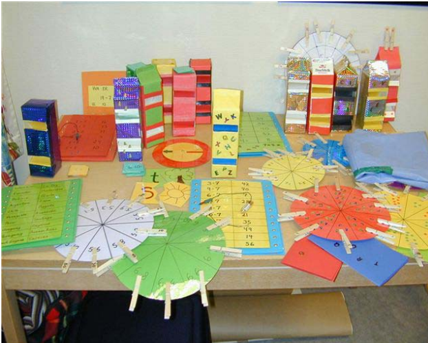
Kinestetiske og taktile hjelpemidler